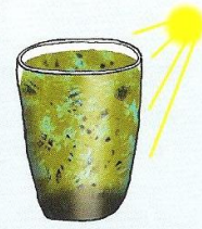
85.1: Vorbereitung für dein Experiment