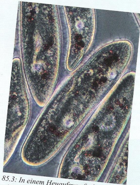
85.3: In einem Heuaufguss findet man mit etwas Glück zahlreiche Pantoffeltierchen.